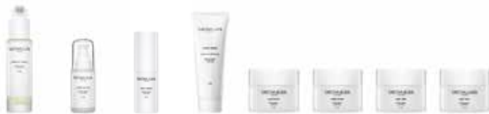
INTENSIVE HAIR OIL