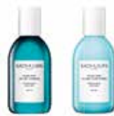
OCEAN MIST VOLUME